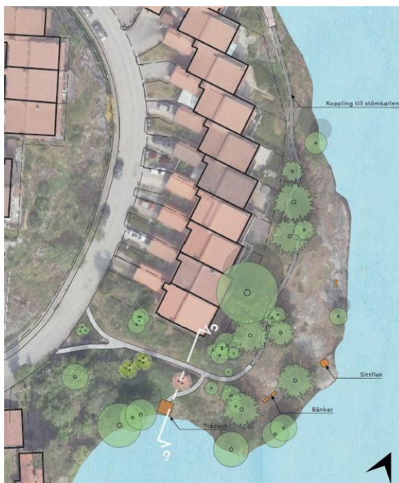
Programskiss för ny gestaltning av Strandparken.

I Strandparken görs varsam komplettering av sittplatser i vattennära läge. Även ett trädäck byggs i närheten av sjön som gör det möjligt att komma nära vattnet. Gångstråket som förbinder Strömkarlen med Strandparken föreslås förbättras för ökad tillgänglighet.